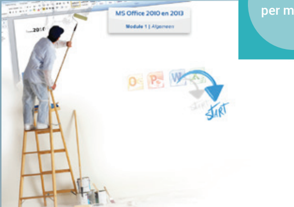
Startschem per module