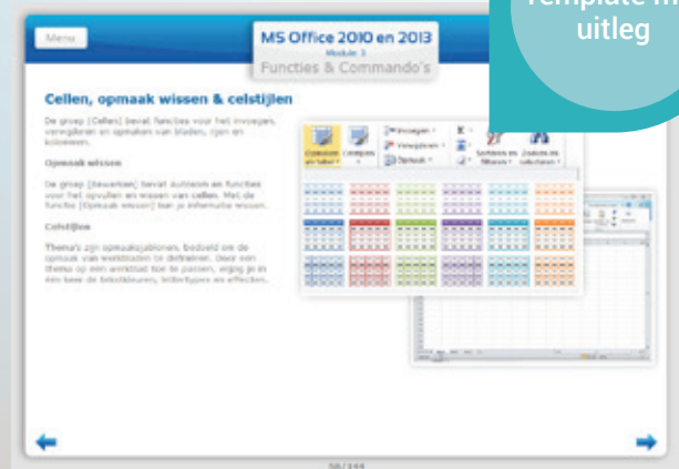
Template met uitleg